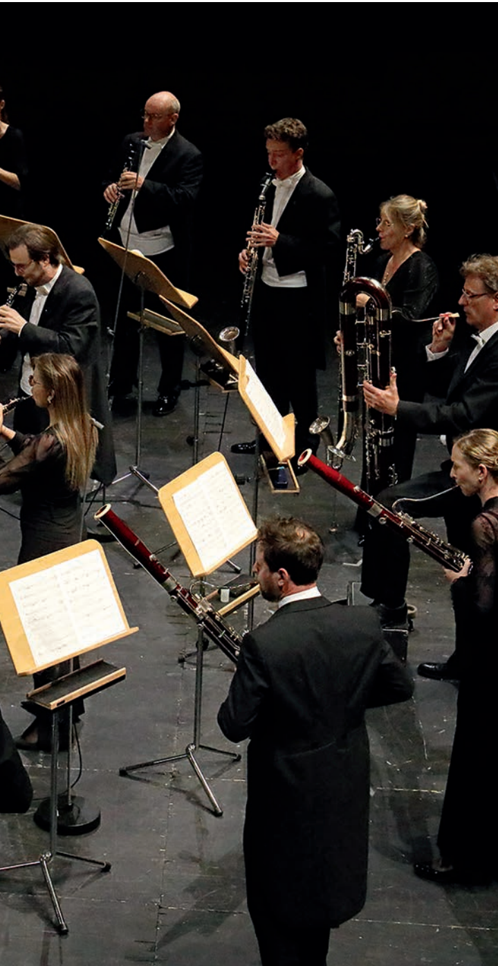
Vladimir Jurowski und das Bayerische Staatsorchester